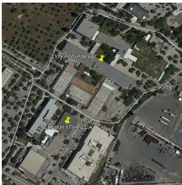
Εικόνα 4: Δορυφορική άποψη εγκαταστάσεων Πανεπιστημιούπολης Π2 και διαθέσιμες εκτάσεις για εγκατάσταση Φ/Β

Οι διαθέσιμες περιοχές για εγκατάσταση Φ/Β συστημάτων παρουσιάζονται στην εικόνα: