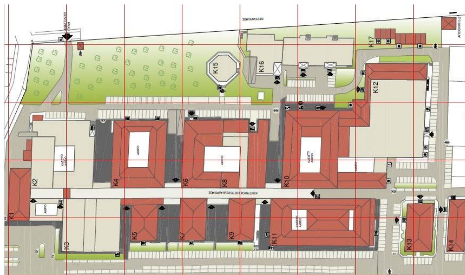
Εικόνα 3: Κτήρια Πανεπιστημιούπολης Π1

Τα κτήρια στα οποία θα γίνει αντικατάσταση των φωτιστικών φαίνονται στο κάτωθι τοπογραφικό: