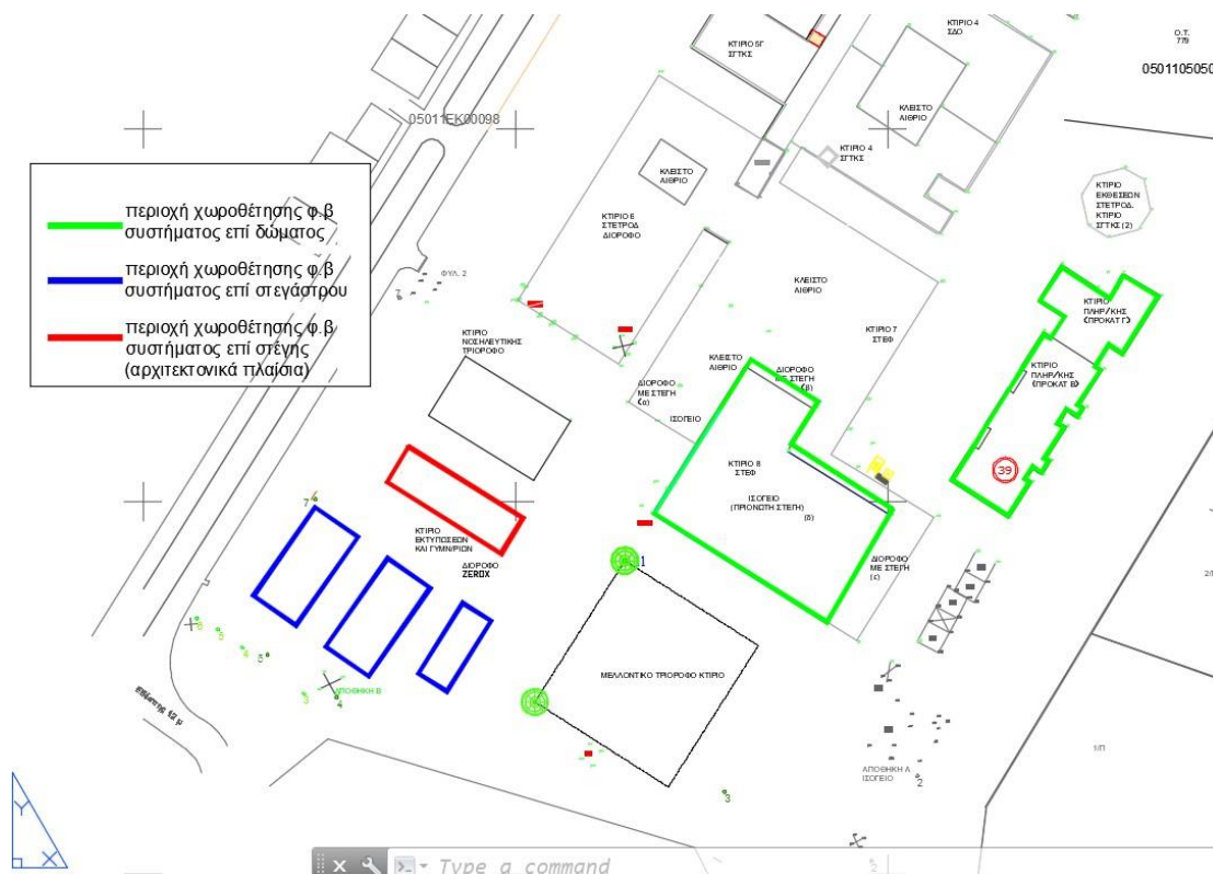
Εικόνα 2: Θέσεις χωροθέτησης στις εγκαταστάσεις της Π1.

Για την τοποθέτηση των Φ/Β συστημάτων στην Πανεπιστημιούπολη Π1 επιλέχθηκαν το Κτήριο της Νοσηλευτικής (1978,29 τ.μ.), το Κτήριο της Πληροφορικής (4736,07 τ.μ.), το Γυμναστήριο-Κτήριο Εκτυπώσεων (873,96 τ.μ.) και το Κτήριο 8 (περ. 2200 τ.μ.). Σημειώνεται ότι εκτός από τις στέγες/ δώματα των κτηρίων αυτών, διαθέσιμος προς χωροθέτηση είναι και ο χώρος στάθμευσης ΙΧ οχημάτων.