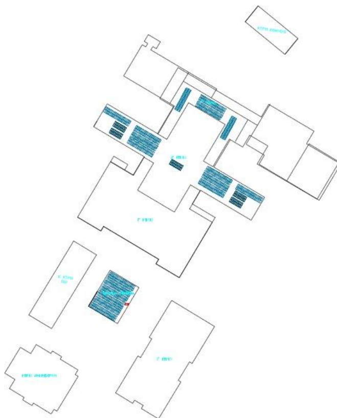
Εικόνα 6 Ενδεικτική χωροθέτηση στις εγκαταστάσεις της Π2.

Προμήθεια και εγκατάσταση συστήματος ενεργειακής διαχείρισης BEMS στο συγκρότημα κτηρίων ΑΒΓ στην Πανεπιστημιούπολη Π2.