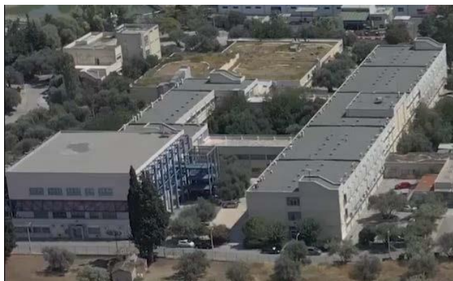
Εικόνα 5: Άποψη συγκροτήματος κτηρίων ΑΒ της Πανεπιστημιούπολης Π2

Ευρωπαϊκή Ένωση Ευρωπαϊκό Ταμείο Περιφερειακής Ανάπτυξης